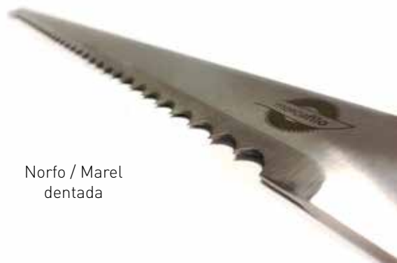
Norfo / Marel dentada

Si necesita modificar, sobre plano o muestra, fabricamos series limitadas