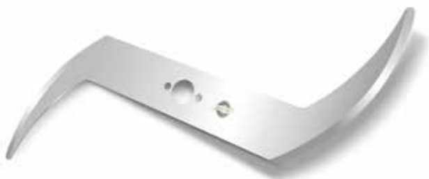
Treiff hélice (doble ala)

Si necesita modificar, sobre plano o muestra, fabricamos series limitadas